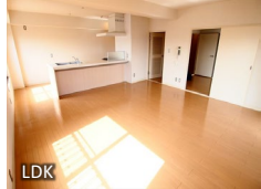
※室内写真は、2021年3月撮影のものです。