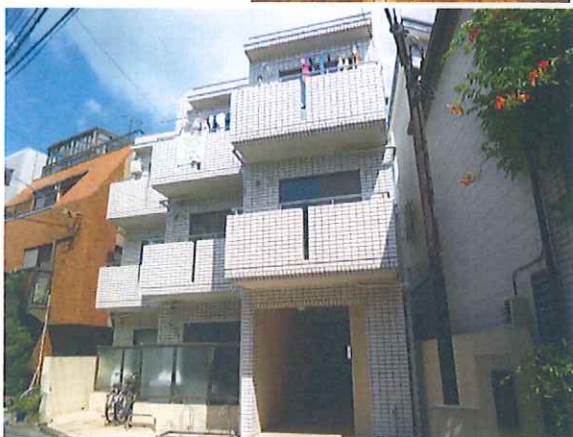
図面と現況が異なる場合は現況を優先させていただきます。